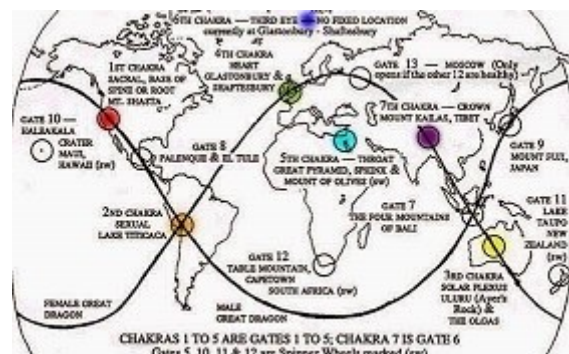
Les Chakras de la Terre

Ces lieux manifestent l'énergie divine en action par la présence de la Kundalini de la terre, implantée auparavant dans le centre de Shamballa au Tibet qui après un long voyage est venue s'installer au lac Titicaca. Notre mission est de comprendre et d'accepter la présence de l'Energie Divine en chacun de nous. La première étape pour comprendre cette grande présence est d'ouvrir nos cœurs et de libérer notre esprit et nos mémoires déléterés qui proviennent du passé et nous retiennent prisonnier dans l'illusion de la séparation avec le divin en nous.