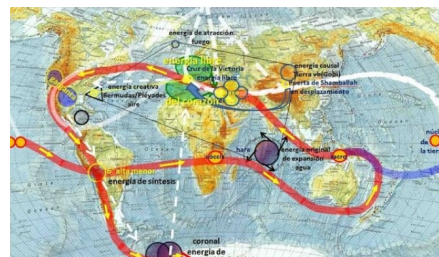
Les Chakras de la Terre

Ces lieux manifestent l'énergie divine en action par la présence de la Kundalini de la terre, implantée auparavant dans le centre de Shamballa au Tibet qui après un long voyage est venue s'installer au lac Titicaca. Notre mission est de comprendre et d'accepter la présence de l'Energie Divine en chacun de nous. La première étape pour comprendre cette grande présence est d'ouvrir nos cœurs et de libérer notre esprit et nos mémoires délétères qui proviennent du passé et nous retiennent prisonnier dans l'illusion de la séparation avec le divin en nous.